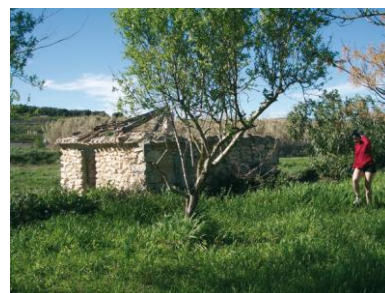
Pou en ruïnes.