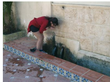
Font de l'Horta.

Més avant, veiem a la dreta (1,32), molt prop del camí, les restes de la maquinària ja oxidada d'una altra molineta. De seguida prenem un camí de terra a la dreta (1,45). El camí desemboca aviat (1,65) en un camí asfaltat. Just ací, a la dreta, trobem les restes d'un molí de vent que servia per a extraure l'aigua del pou. Encara podem observar la maquinària i imaginar-nos com es feia el procés d'extracció. A la nostra dreta de nou, queden les restes d'un altre molí d'aigua (2,13). Al final del camí del Boticari (2,18), girem a la dreta i passem per un altre pou: el pouet del Moro". Arribem a la CV-741 (2,33),