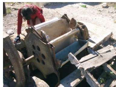
Pou en ruïnes.

que creuem per continuar pel camí que tenim davant. Aquest curt tram és el més dur de la ruta, ja que, a més de la costa, ens hi trobem un poc de trànsit. Arribem a la part alta (2,90), des d'on es contemplen unes magnífiques vistes de tota la zona. A l'esquerra tenim la serra de Bèrnia i d'Oltà. Passem per un pont les vies del tren (3,65) i de seguida arribem a la CV-7470 (3,77). Mirem a la dreta i veiem el camí del pouet de Berdica pel qual continuem. Arribem a un Stop (4,51) i seguim recte i deixem la casa a la nostra esquerra. Aquest tram és més agrest i hi abunden les figueres, les figueres de pala i les garroferes. Veiem una casa xicoteta (5,03) de color beix a la dreta i uns metres més avant (5,07), un camí de terra amb una caseta a la dreta per la qual hem de continuar. Al principi és bastant pedregós, però al poc el ferm millora. Continuem sempre recte per aquest camí i entrem en Teulada pel polígon industrial, fins a arribar a una rotonda on veiem un carril bici a la nostra dreta (6,40) pel qual continuem. Arribem a la rotonda de l'avinguda del Mediterrani (6,90) i des d'ací ens dirigim de nou a l'estació del tren (7,15).