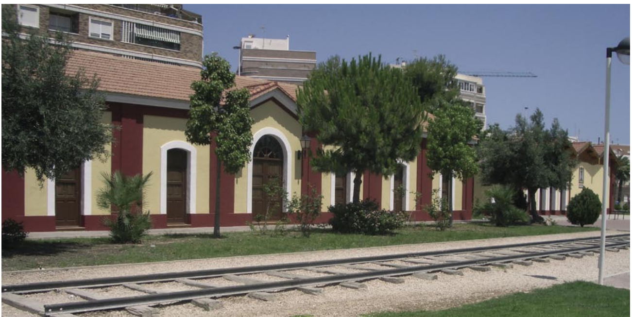
Antigua estación de Torrevieja.