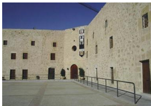
Fuerte de Santa Pola