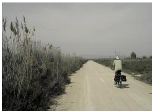
Caminos del Parque Natural de las Salinas.

Salimos de Santa Pola por la carretera CV-865 que va a Elche. Pasamos el camping "Bahía" y 1 km después vemos a nuestra izquierda una casa de color rosado llamada "El Xipreret". Donde está la señal de prohibido el paso a vehículos no autorizados, ponemos el cuentakilómetros a 0. Estamos ya dentro del Parque Natural de las Salinas de Santa Pola. Pasamos una barrera. El camino es de tierra con algunas piedras. Ya vemos al fondo una de las lagunas. Tomamos el primer camino a la derecha (0,32) y giramos por él. Dejamos un camino a la izquierda (0,53) y seguimos recto dejando a nuestra derecha un edificio en ruinas. Ahora el camino es ancho y en buen estado y a la izquierda vemos ya las salinas. El atardecer desde esta