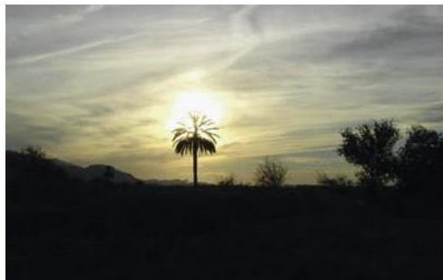
Atardecer en el Parque Natural de El Hondo.

Giramos a la izquierda, cruzando el canal (23,15) y giramos a la derecha por el camino paralelo a este. Llegamos a una carretera (23,30) y seguimos por el camino asfaltado que tenemos enfrente, con un canal a su izquierda. El camino topa con la entrada del Parque Natural de El Hondo, al que accedemos por la puerta metálica (23,76) que suele estar cerrada. Pero si seguimos unos metros la valla a la derecha, podemos continuar el camino. Este es uno de los tramos más agradables de la ruta, en el que suele haber pescadores y charcas naturales (29,18) y seguimos las indicaciones a la izquierda para visitar el Centro de Interpretación del parque (30,30).