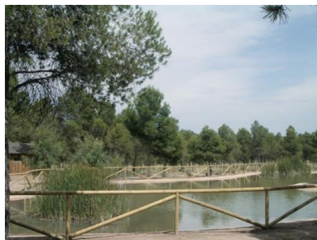
El Toll. El Pla.

l'esquerra. Arribem a un entresolat (16,00) sobre un canal cementat des d'on podem albirar tota la vall. Deixem un camí asfaltat a l'esquerra (16,64) i seguim recte. Deixem el camí que porta al Pla (18,90) i seguim la corba a l'esquerra per a dirigir-nos a la Colònia de Santa Eulàlia. Desconnectem a la porta del bar Casinete (20,69). Per a continuar eixim per on hem entrat i prenem el primer camí a l'esquerra (20,00). Arribem a un Stop (20,35) i seguim la indicació d'El Pla. Després d'una suau pujada arribem a aquest