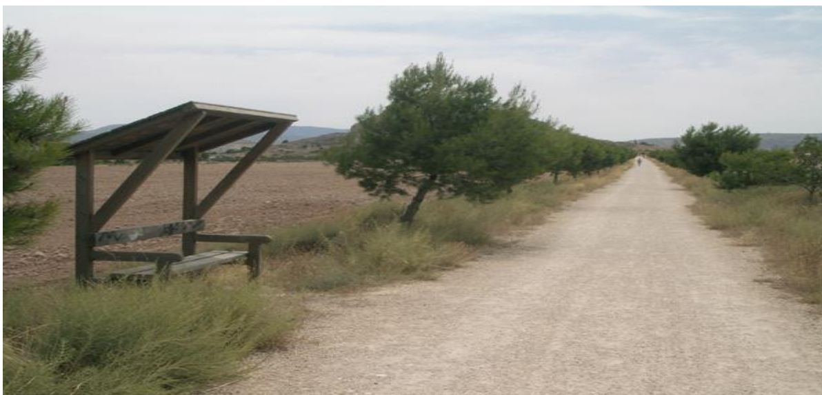
Via verda del Xixarra.

paratge que, com el nom indica, és pla i des d'on comencem a albirar al fons la silueta del castell de Sax. Veiem un camí a l'esquerra (22,91) que porta (si volem visitar-la desconnectem ací ja que la ruta segueix recte) a la magnífica àrea recreativa d'El Pla que la Diputació d'Alacant ha dotat amb Centre de Visitants, serveis, refugis i altres instal·lacions. A més, disposa d'un itinerari senyalitzat per a conèixer la geologia de la muntanya. Arribem a un Stop (23,34) i seguim a l'esquerra. Després d'una suau baixada i amb l'olor de pi, entrem a Sax per la seua banda sud (24,51). La freqüència de trens a Sax és molt reduïda. Si allarguem uns 11 km la ruta podem tornar a Villena i fer així una ruta circular. Per a això, eixim del lloc de la Creu Roja situat en el carrer Jaume I, seguint la indicació de l'ecoparc. Abans del pont, seguim a l'esquerra la indicació del castell i després prenem el primer camí a la dreta. A partir d'ací seguim les fletxes grogues del camí de Santiago que ens portaran, passant de nou per la Colònia de Santa Eulàlia, fins a Villena.