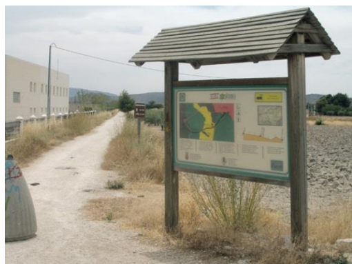
Inici de la ruta.

Reprenem la ruta en el punt en què desconnectem i tornem al baixador per a continuar a l'esquerra, durant un tram, en direcció a Villena. Arribem a un Stop (9,47) i uns metres més avant prenem un camí asfaltat a la dreta amb el senyal de prohibició a vehicles de més de 10 Tm. En els pròxims